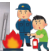
年1回行われている災害訓練の様子