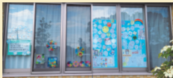
窓に掲示された応援メッセージ

コロナ過に多くの皆様より、様々なご支援を頂きました。この場を借りて御礼申し上げます。様々な物資や資金援助を頂いております。また、平和台病院と隣接する創価学会我孫子文化会館様より応援メッセージを頂きました。これまで皆様より寄せられた温かいご支援に対して感謝を申し上げます。