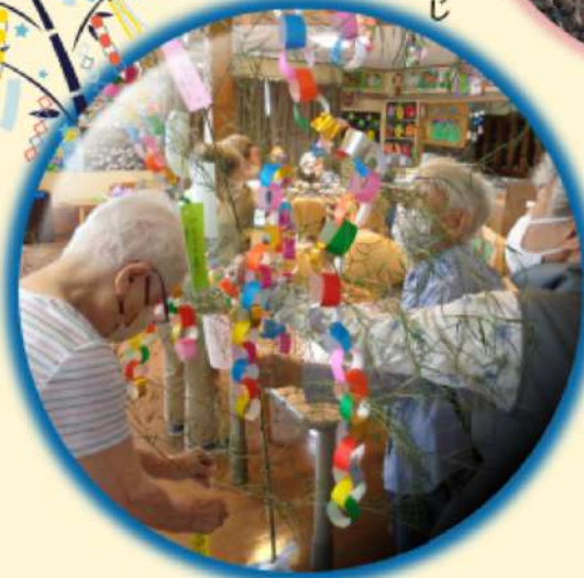
七夕祭りを皆と一緒に飾る