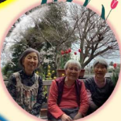
ベランダにて春の訪れを感じ