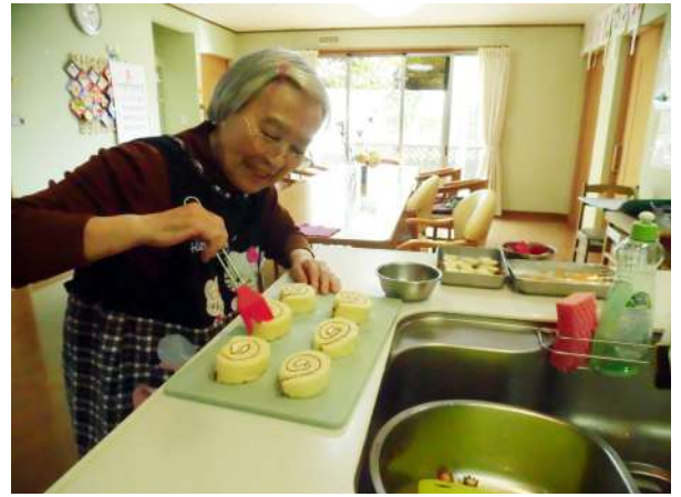
(左) グループホームの皆さんでレクリエーションに取り組んでいます。 (右) ただいまおやつ作りにも挑戦中！