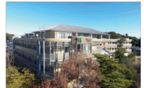
介護老人保健施設クレオ