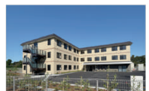
サービス付き高齢者向け住宅 アビーサあらか野