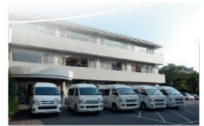
介護老人保健施設エスピーロ

認定期間：2024年1月6日 ~ 2029年1月5日 (認定第JC1943-3号)