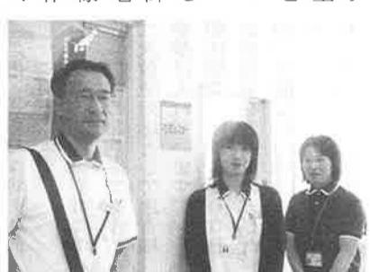
どちらの事業所共お気軽に御相談ください。

私達、介護支援専門員(ケアマネジャー)は「在宅生活を心豊かに暮らせる」を目指して、介護保険等の様々なご相談に応じます。